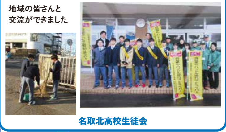
地域の皆さんと交流ができました 名取北高校生徒会