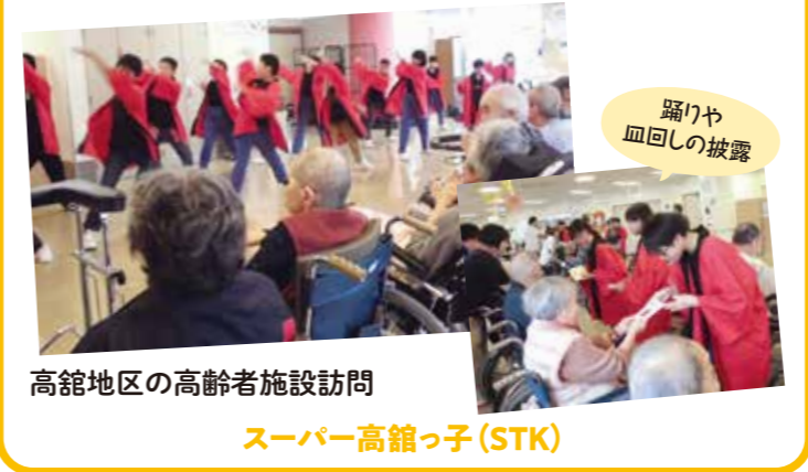
高館地区の高齢者施設訪問 スーパー高館っ子(STK)