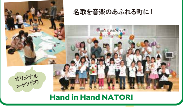
名取を音楽のあふれる町に! オリジナルシャツ作り Hand in Hand NATORI