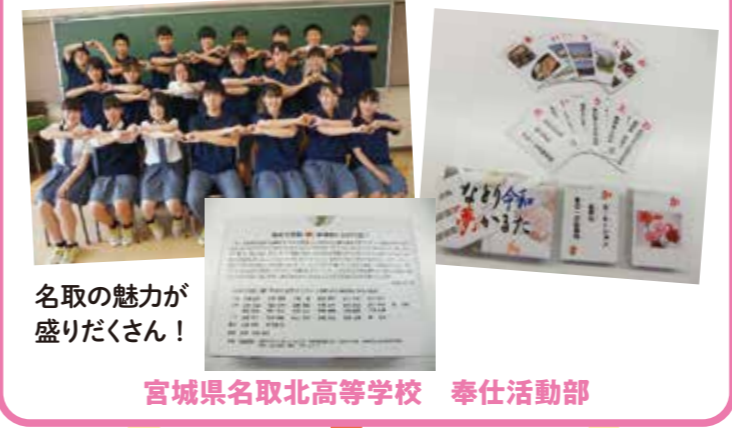
名取の魅力が盛りだくさん! 宮城県名取北高等学校 奉仕活動部