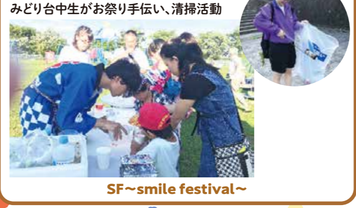
みどり台中生がお祭り手伝い、清掃活動 SF～smile festival～