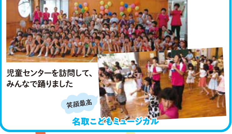
児童センターを訪問して、みんなで踊りました 笑顔最高 名取こどもミュージカル