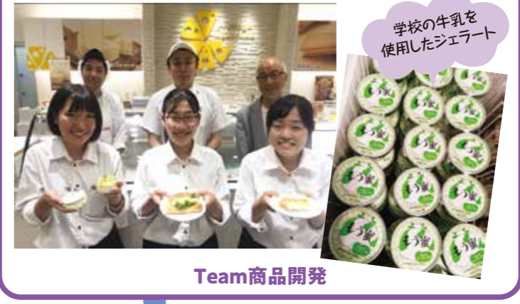
学校の牛乳を使用したジェラート Team商品開発