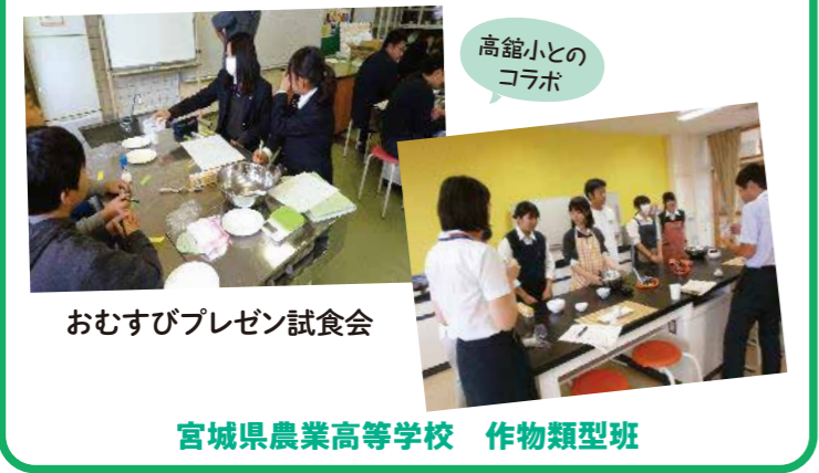
高館小とのコラボ おむすびプレゼン試食会 宮城県農業高等学校 作物類型班