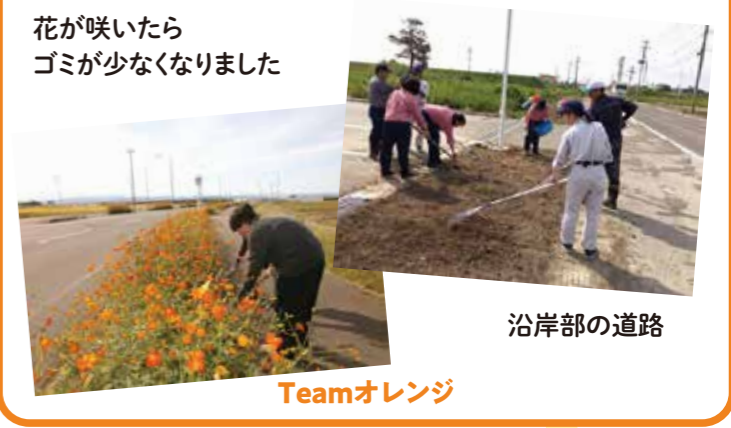
花が咲いたらゴミが少なくなりました Teamオレンジ