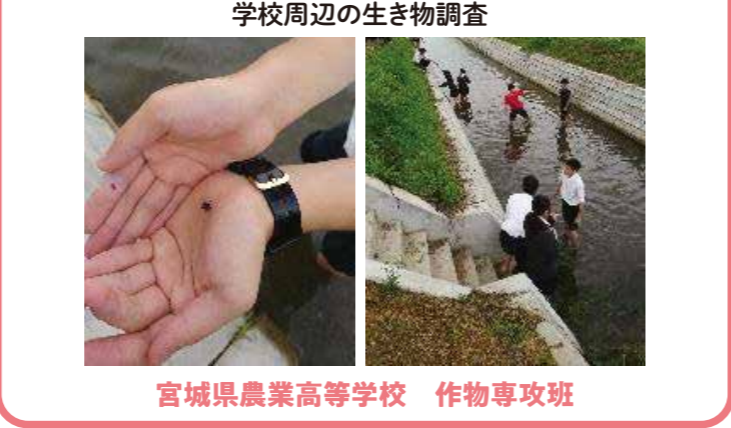
学校周辺の生き物調査 宮城県農業高等学校 作物専攻班