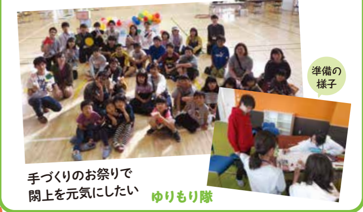
手づくりのお祭りで開上を元気にしたい ゆりもり隊