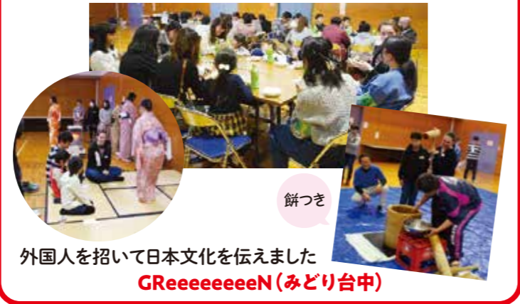
外国人を招いて日本文化を伝えました GReeeeeeeeN(みどり台中)